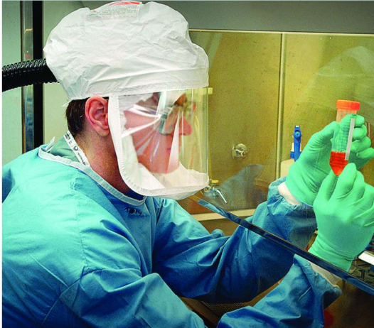
Atlanta Un ricercatore del Center of Disease Control and Prevention, Georgia

L'allerta Usa per i casi di vaiolo «Preoccupati»